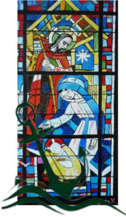
Peinture du vitrail de la nativité de la Basilique de St Laurent-sur-Sèvre Réalisée par Mme Agnès Retailleau

« N'ayez pas peur Ouvrez, ouvrez toutes grandes les portes au Christ. En cet Enfant, Dieu nous invite à prendre en charge l'Espérance. Il nous invite à être des sentinelles pour beaucoup de personnes qui ont cédé sous le poids du désespoir qui naît du fait de trouver fermées de nombreuses portes.